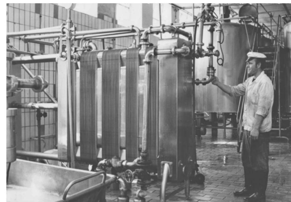
Butterwerk, Müncheberg 1987

Eigentlich ist das eine ganz traurige Entwicklung. Da kann man echt wehmütig werden, wie das mal früher war und wohin sich das entwickelt hat. Das hat man die erste Zeit nach der Wende gar nicht so mitgekriegt, aber wenn man jetzt mal so zurückschaut, ist schon enorm diese Veränderung, die da stattgefunden hat. Man muss ja eine komplett andere Lebensweise an den Tag legen. Hätte ich gar nicht gedacht, dass das so eine Tragweite entwickeln würde. Dieses Miteinander war ein ganz anderes, der soziale Aspekt war im Vergleich riesengroß. Als wir noch Osten waren haben wir gedacht: „Was für ein sozialer Aspekt, was