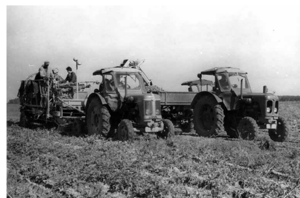
Kartoffelkombi, Pflügen mit Gespannpflug, 1950