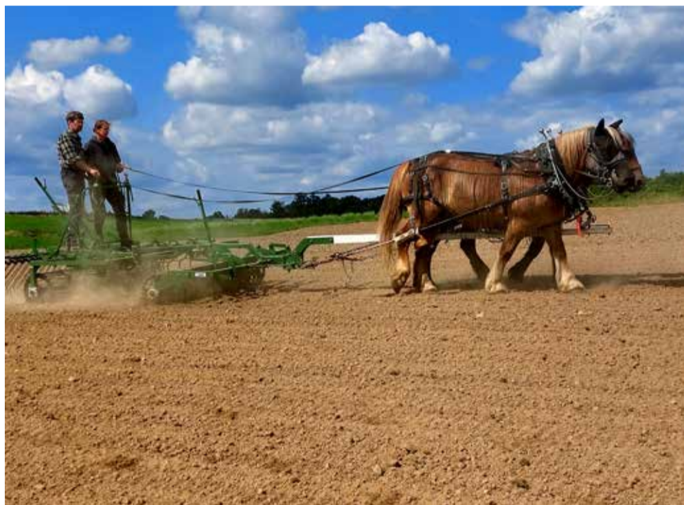
Auf dem Acker eher selten: Dahmsdorfer Pferde vor dem Pflug

lagen. Das sind bei einer Solar-Anlage von 30 Hektar ca. 60.000 Euro im Jahr für die Kommune. Dem gegenüber stehen ca. 1,5 Millionen Euro Gewinn für den Investor. Und die Anwohner? Rechtlich sicher ist ihnen keine Gewinnbeteiligung. Ein anderes Modell, bei dem auch Anwohner finanziell profitieren, ist die Bürgergenossenschaft. Im Nachbarort Heinersdorf gibt es die Bürgerenergie Oder-Spree eG (Beos). Dem Prinzip einer Genossenschaft folgend bleibt die Wertschöpfung bei den Genossenschaftsmitgliedern. Gemeinsam entscheiden sie, ob sie investieren, in was sie investieren oder ob sie die Gewinne ausschütten. Dabei liegt ein besonderer Fokus auf demokra-