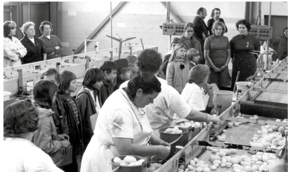
Kartoffellager, Ende 1970er | Foto: Archiv Heimatgeschichtsverein