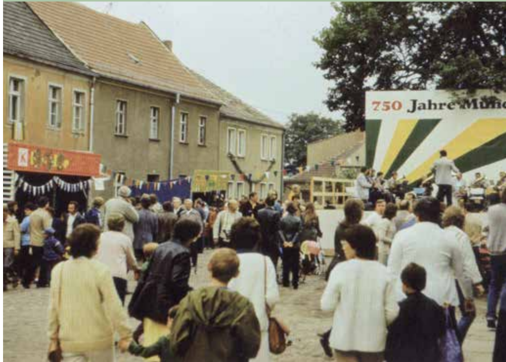
1982 am Alexanderplatz