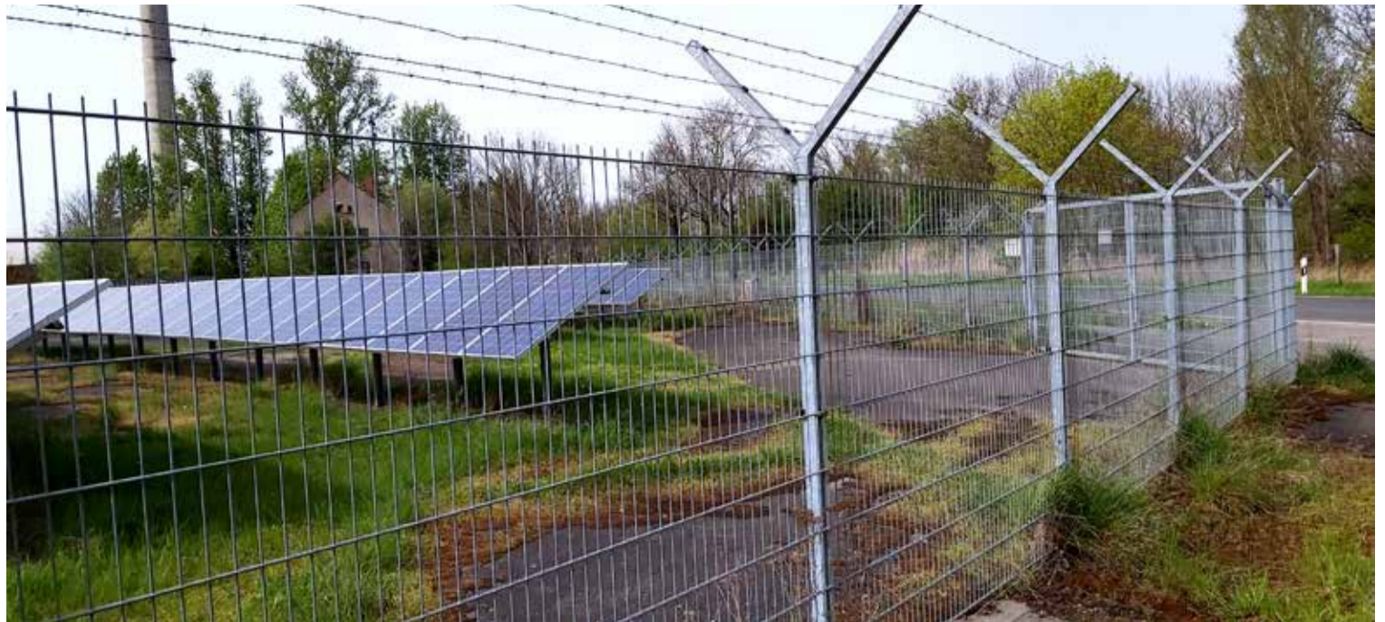
PV-Anlage im Oderbruch

gen, dass die Artenvielfalt auf den Flächen gefördert wird.“ Gleichzeitig lassen sich laut Naturschutzverbänden keine pauschale Aussage dazu treffen, wie sich die Artenvielfalt auf PV-Flächen entwickelt. Dies hängt u.a. davon ab, wie die Fläche vorher genutzt wurde, ob es eine Brache oder ein Acker mit Monokultur war, aber auch wie dicht die Solarmodule verlegt werden. Eine Gewinnbeteiligung an den Anlagen ist für die Kommune rechtlich über den Solar-Euro festgelegt: Ab 2025 bekommen betroffene Kommunen pro Megawatt installierter Leistung jährlich 2.000 Euro von den Betreibern neuer An-