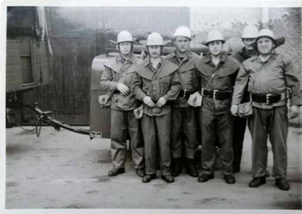
1988 Feuerwehr Einsatzgruppe der VEG (T) Müncheberg

1976 bin ich in die Feuerwehr in Buckow eingetreten, durch einen Arbeitskollegen, der mich geworben hatte. Hier in Müncheberg war ich dann in der Betriebsfeuerwehr vom VEG. Als nach 1989 die Betriebsaufgelöst wurden, wurden auch die Betriebsfeuerwehren aufgelöst. Manche sind in die Feuerwehr gegangen, weil sie nicht in die Kampfgruppen gehen wollten, das war sozusagen eine Alternative. Aber dann nach der Wende konnte man diejenigen an der Hand abzählen, die in der Stadtfeuerwehr weitergemacht haben. Man musste ja keine gesellschaftliche Tätigkeit mehr leisten, wie das hieß, also haben die meisten damit aufgehört. Aber die waren auch nicht vom Herzen dabei, haben das nur gemacht, weil sie das machen mussten, um nicht anzuecken.