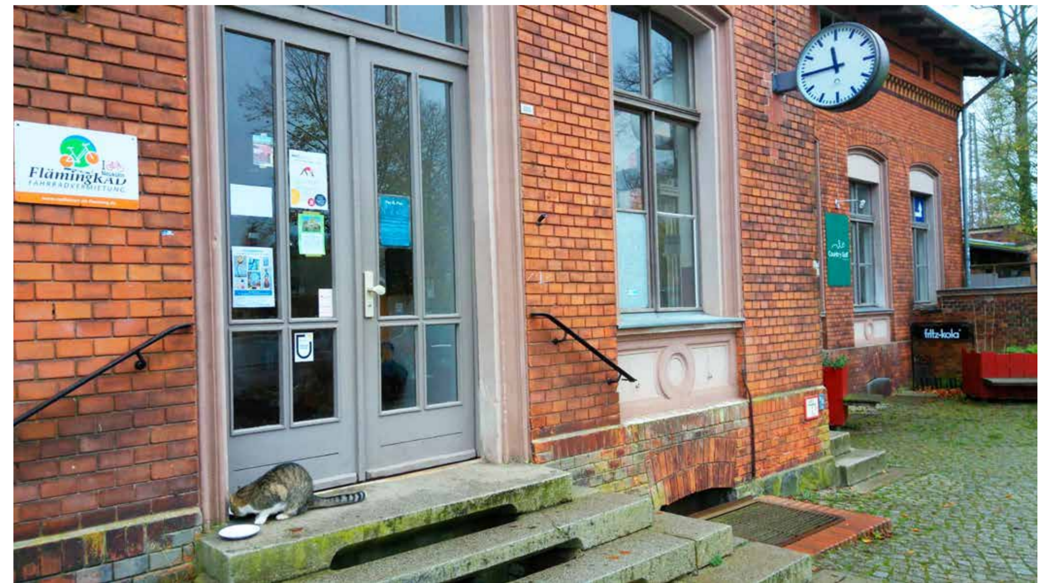
Der Bahnhof in Wiesenburg ist seit 2011 im Besitz einer Bürgergenossenschaft und zur Zeit ein multifunktional genutztes Gebäude

Der Bürgermeister der etwas über 4000 Einwohner zählenden Gemeinde im Hohen Fläming ist auch über Brandenburg hinaus kein Unbekannter. Was er seit seiner ersten Wahl vor zehn Jahren versucht, in seiner Gemeinde zu bewegen, ist von starken Visionen geprägt, für die er zusammen mit anderen engagierten Menschen streitet und durchaus hohe Risiken bereit ist, in Kauf zu nehmen - allerdings nicht zulasten der Bürger. Weil seine Kompetenz derart geschätzt wird, wurde Beckendorf 2022 mit großer Mehrheit im Amt bestätigt. Dieses verfolgt