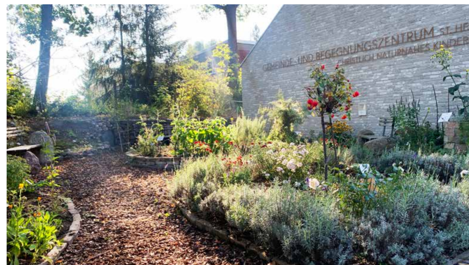
Liebevoll angelegter und gepflegter Bibelgarten vor dem GBZ lädt zum Verweilen ein.

„Es war ein sehr spannendes Erlebnis, weil sich die damals noch eigenständige Kuratie und Kirchengemeinde klar werden musste, welche Rolle sie nicht nur innerhalb der Katholischen Kirche im Erzbistum Berlin spielen möchte, sondern vor