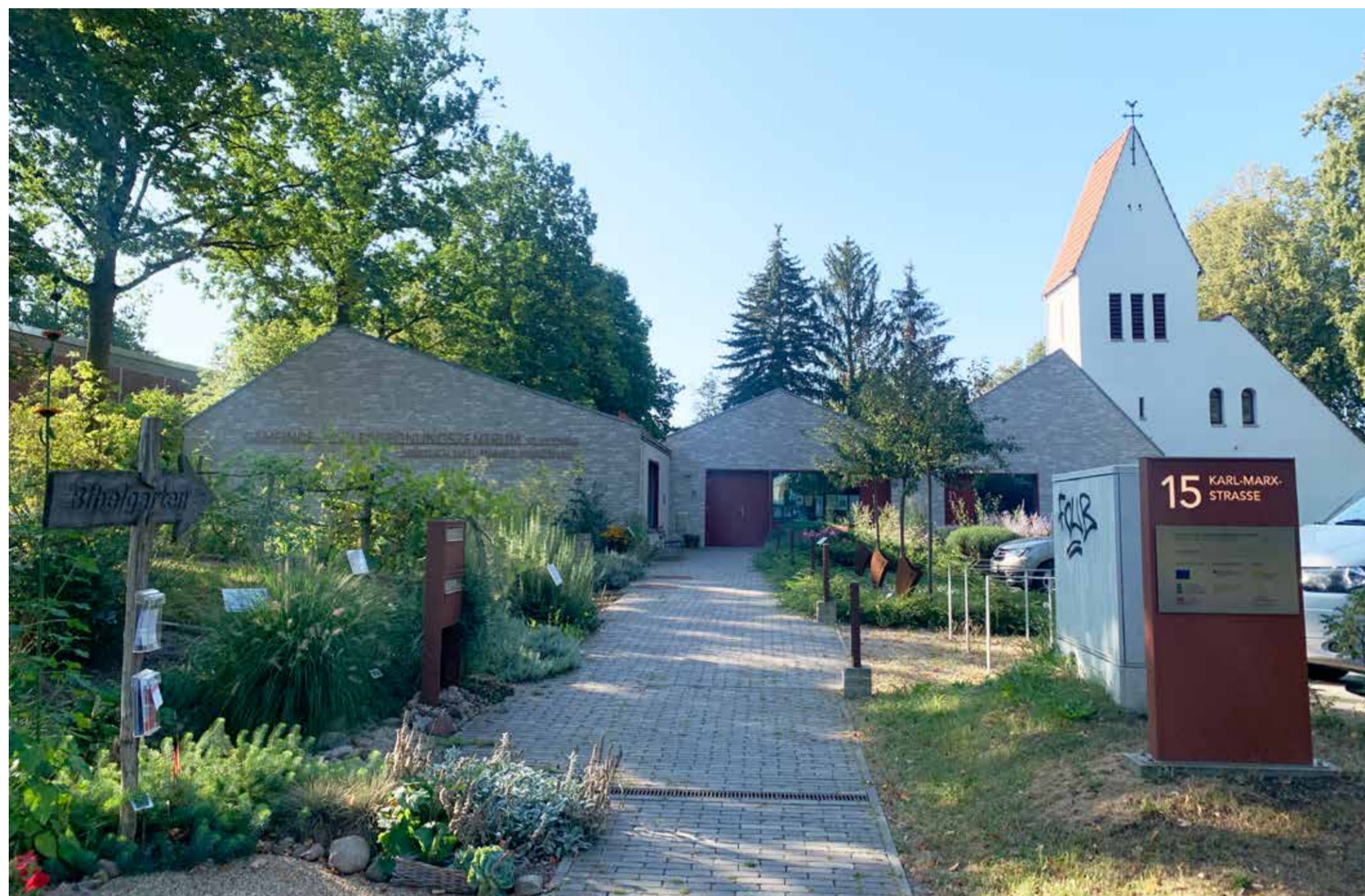
Gemeinde- und Begegnungszentrum St. Hedwig, 2021 eröffnet, „leuchtet“ als Neubau an der Karl-Marx-Straße.

KATHOLISCHES GEMEINDEZENTRUM NACH MÜNCHEBERG GEHOLT