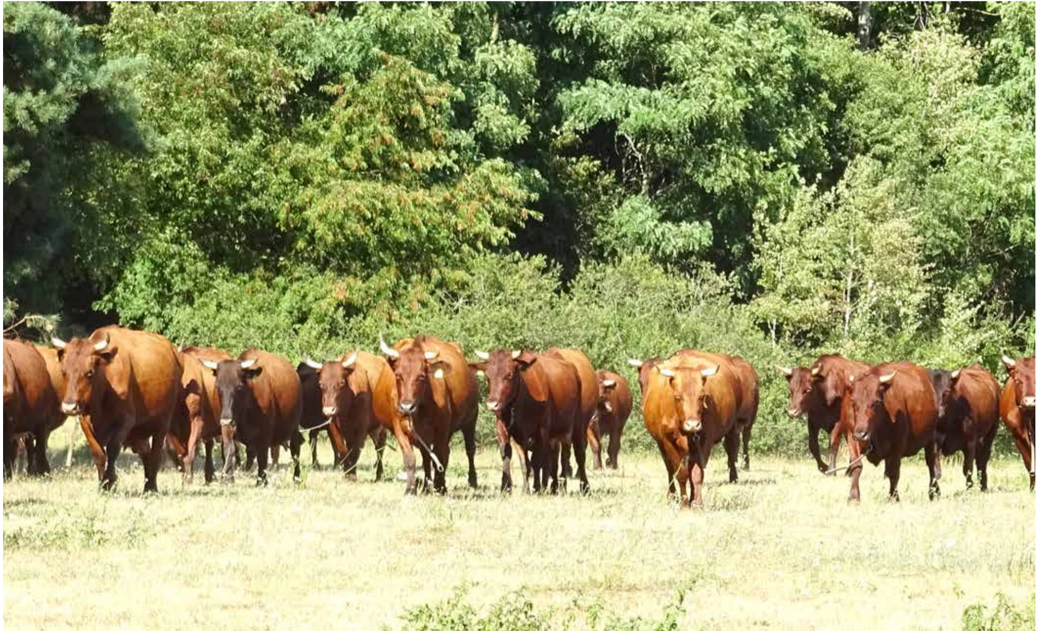
Rotviehherde auf der Weide in Marienhöhe