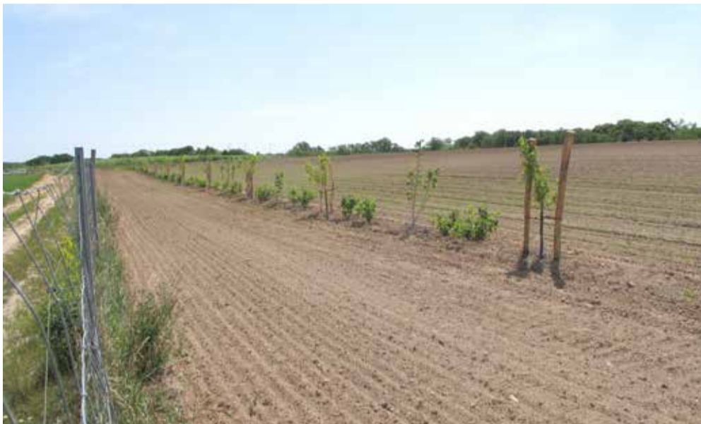
Keylines auf dem Waldpferdehof (Bild oben), die noch junge „essbare Hecke“

der essbaren Hecke, die sich etwas weiter westlich über eines der Felder zieht. Die Hecke, die aus Beersträuchern und Obstbäumen besteht, bietet nicht nur einen Lebensraum für Vögel, Insekten und Kleintiere, sondern trägt auch dazu bei, ein Mikroklima zu schaffen, das der Trockenheit besser standhält.