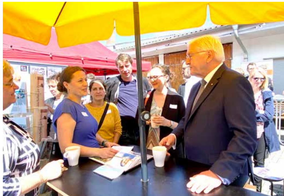
Einfach mal zuhören - das gelang dem Bundespräsidenten im Gespräch ganz gut. Auch am Stand des Thälmanns.

Vertreterinnen vom Kultus-Projekt Café-Bar im Thälmanns, sondern auch der Buchladen Wohlbehagen vom Buckowina e.V. aus Buckow und der Wulkower Verein „Ökospeicher“. Überall stemmen Ehrenamtliche die Café- und Ladenschichten, gleichen die Lücken aus, die ökonomische und politische Umbrüche und Verfehlungen gerissen haben. Weil es fehlt an Orten, an denen Menschen niedrigschwellig zusammenkommen können – und auch