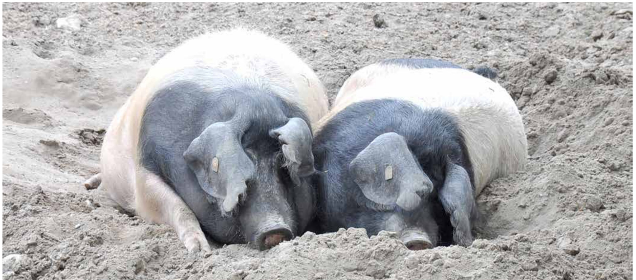
Sattelschweine in Marienhöhe

steigenden Ausgaben kompensieren müssen und die immer weniger Verbraucher zahlen können oder wollen: Das Maß dessen, was viele kleine bis mittelgroße Landwirtschaftsbetriebe neben der körperlichen Arbeit noch stemmen können, ist lange erreicht. Selbst erfolgreiche Betriebe geben auf, allein, weil ihnen ihr Beruf verleidet wird. >>